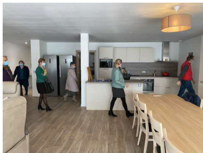
Visite de la résidence Âges & Vie de Villeneuve sur allier le 5 février 2021 par les membres de la commission Santé & Solidarité

Ce projet engage la commune, faites-nous part de l'intérêt que cela peut représenter pour vous ou pour vos proches.